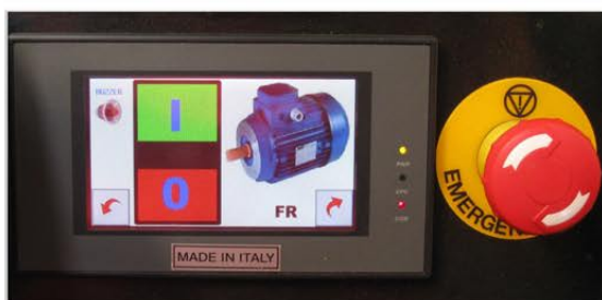
Avvio pompa e pulsante emergenza Pump starter and emergency button