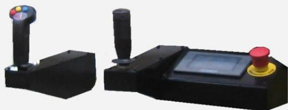
Pulsantiera di controllo Control panel with pushbuttons