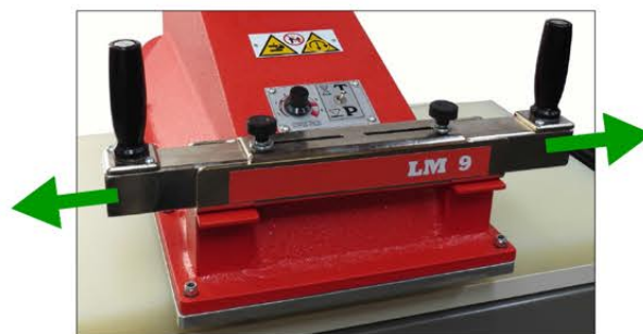
Pulsanti di comando regolabili Buttons with adjustable width

Completely built in Vigevano, the LM swing cutting machines series are the result of ARES thirty years experience in die cutting. The machines of this series are designed for the most demanding customers, reaching high quality standards: they are refined in detail and further expands our range of cutting machines.