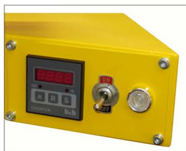
Contacolpi elettronico Electronic stroke counter

Completamente costruite a Vigevano, le fustellatrici a braccio rotante della serie LM sono il risultato della trentennale esperienza del gruppo ARES nel settore del taglio tradizionale a fustella. Le macchine di questa serie sono progettate per i clienti più esigenti, raggiungendo standard qualitativi molto alti: vengono curate nei minimi particolari e allargano ulteriormente la gamma di fustellatrici ARES.