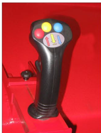
Particolare manopola con pulsanti di comando Detail of handle with push-buttons control

Each Magic Flap model is equipped with programmable automatic head return and powered feed rate; versions with control bar (BA) are equipped with protective grating and photo-electric guard .